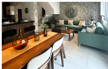
SALA / COMEDOR