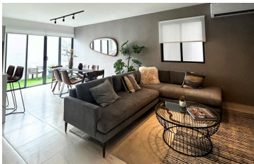
SALA / COMEDOR